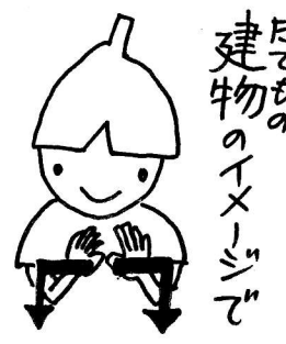
建物のイメージで